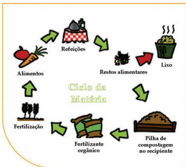
Figura 1 – Ciclo da matéria orgânica