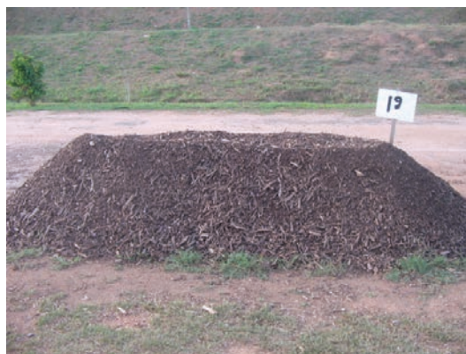
Figura 2 – Leira de compostagem, Parque socioambiental de Canabrava – Salvador, BA

Recomenda-se iniciar a montagem das leiras ou pilhas colocando uma camada de 10 cm de altura de podas ou galhos de árvores picados. É importante não formar camadas com um único tipo de material.