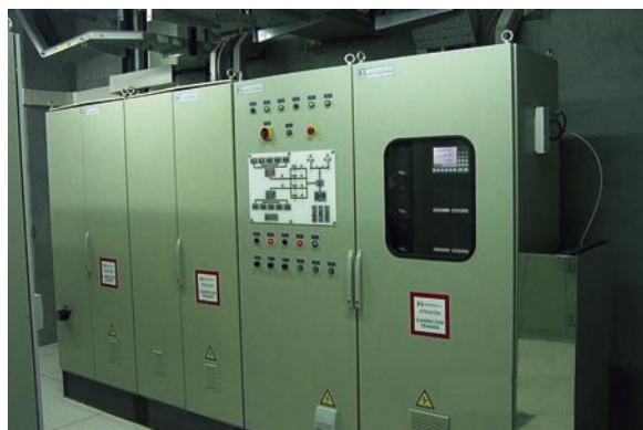
Control Central de Captación

En este sentido y considerando la metodología aprobada por el Banco Mundial para la determinación de emisiones de carbono a la atmósfera, la planta de captación de biogás de Valdemingómez permite una reducción de emisiones de más de 3,2 millones de toneladas equivalentes de CO 2 , considerando tanto la propia eliminación del metano captado como la reducción de emisiones que se obtienen por no precisar el empleo de otros combustibles para generar los casi 800 GWh que se obtendrán en la planta a lo largo de los próximos años. ☞